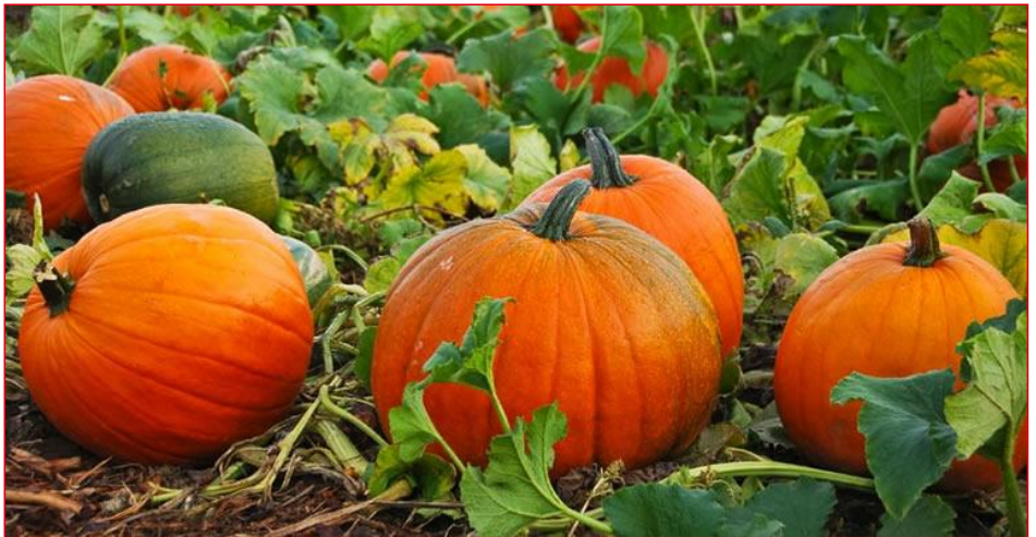
Mister en Misses Pumpkin komen gastlessen geven en gaan o.a. zaaien met de leerlingen. De gemeentelijke sportcoaches geven een beweegles op het plein met o.a. een kruiwagenrace.

Jong leren eten is een programma waarin rijk, provincies, gemeenten, onderwijs en maatschappelijke organisaties samenwerken.