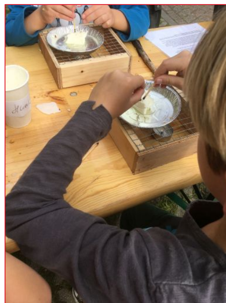
Zelf vetbollen maken, alles zit in het pakket.