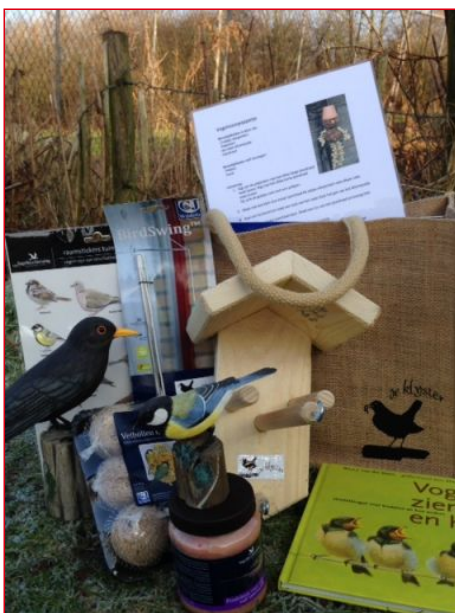
Het pakket wordt op school gebracht.

Met het natuur-in-de-klas-pakket Vogels in de Winter, kun je met je leerlingen o.a. tuinvogels bestuderen en zelf vetbollen maken.