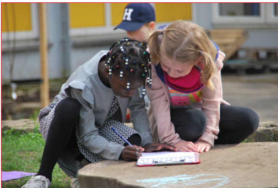
Buiten lesgeven is leuk en gezond. De Klyster helpt graag.

Dinsdag 2 april 2019 is het weer Nationale Buitenlesdag! Op deze dag geven leerkrachten in heel Nederland buiten les.