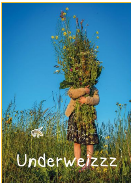
Underweizzz sluit aan bij Silence of the Bees

2018 is een bijzonder jaar. Het is Culturele Hoofdstad én de Klyster bestaat 20 jaar. Het aanbod van de Klyster sluit helemaal aan bij de thema's van LF-2018 en verbindt cultuur met natuur.