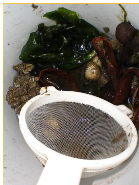
.....en van de wadvondsten kunstwerken.