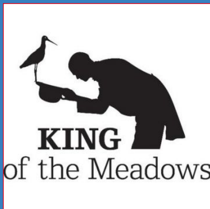
Kening fan de Greide