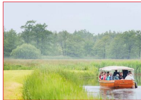
Bermtoeristen sluit aan bij Fossielvrij Fryslân.