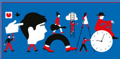
Cultuur op Natuur