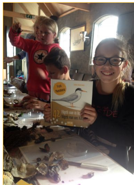
Wadexcursies sluiten aan bij Sense of Place