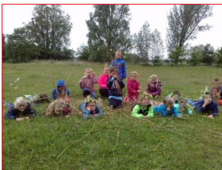
Natuuravontuur en Natuursprong. Spelen tot je groen ziet en de natuur ontdekken.