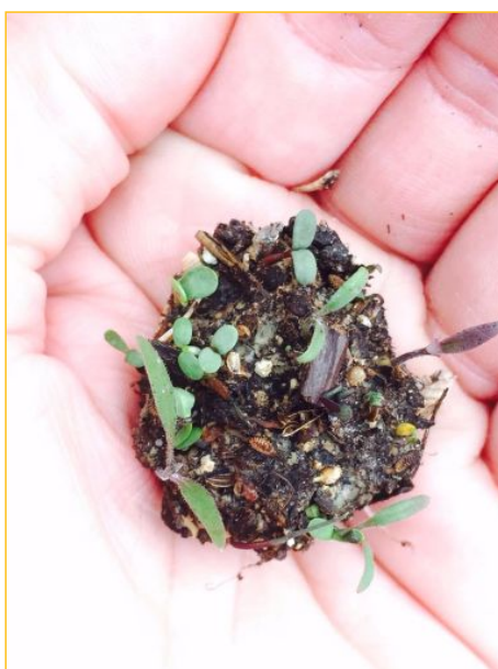
Voor de bijen worden zaadbommen gemaakt..