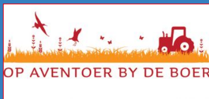
Op Avontoeer bij de Boer