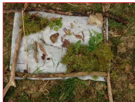
Kijken naar lijnen, vormen en kleuren in de natuur en bezig gaan met Kunst en Land Art.