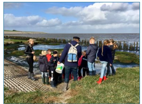
...en daarna met een natuurgids het Wad op.