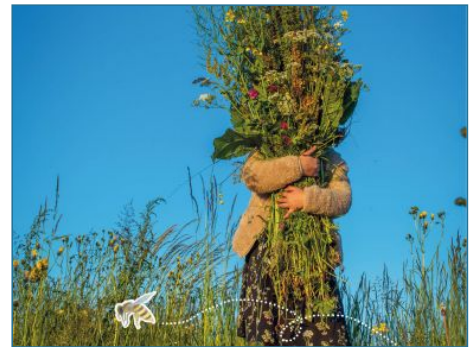
Underweizzz over bloemen, bijen, bermen en biodiversiteit voor groep 8 van het basisonderwijs in Friesland.