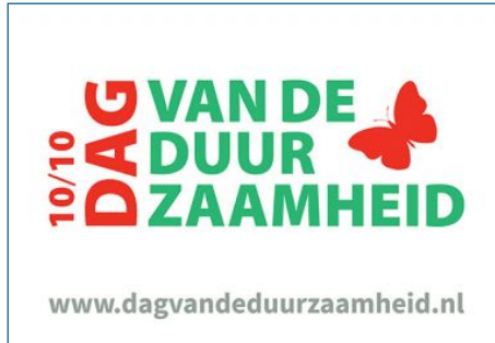
Voorlezen en in gesprek over duurzaamheid...

Op 10-10-2018 deden wethouders en burgemeesters mee aan de voorleesdag voor het basisonderwijs van de Dag van de Duurzaamheid.