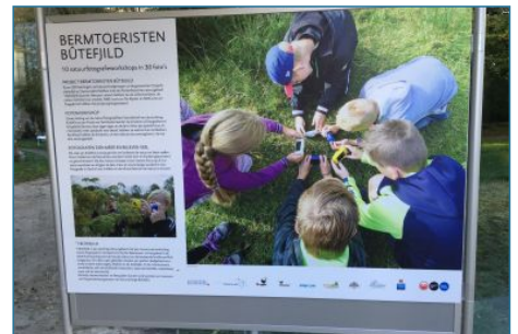
...lint doorknippen en de expositie is geopend!