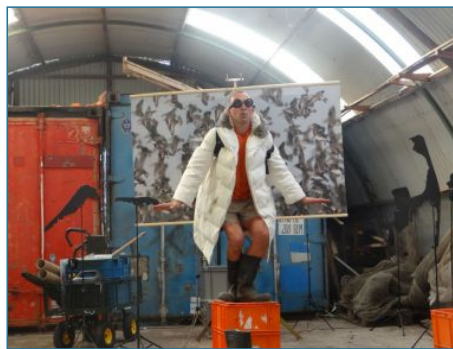
Eerst voorstelling bekijken van Mient en heit...

In september 2018 zijn 1000 leerlingen met begeleiders naar voorstelling Kanoet geweest en hebben daarna een wadstruintocht gemaakt met gids.