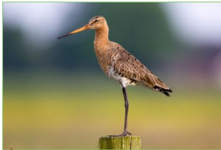
Grutto roept zijn eigen naam 'grutto-grutto'

Het is lente en de weidvogels komen weer naar ons land gevlogen om te broeden. De Grutto is onze nationale vogel: de Kening fan de Greide!