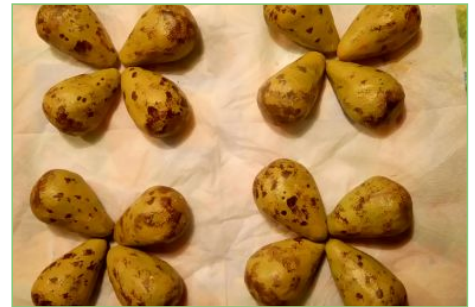
en legt 4 eieren in een nest in het hoge gras.