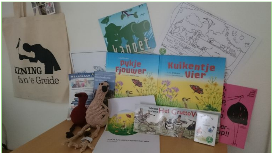
inhoud van de tas met allerlei informatie

Met deze spulletjes kunt u een leuke lentetafel inrichten.