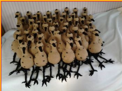
een prachtige minisaksje

Vrijwillige handwerksters uit heel Friesland haakten voor iedere klas een eigen knuffelpykje. Alle Pykjes Fjouwer zijn geringd, zodat u en uw leerlingen kunnen zien waar uw klassenpykje vandaan is komen vliegen.