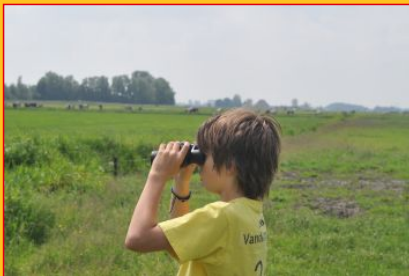
kijken naar vogels