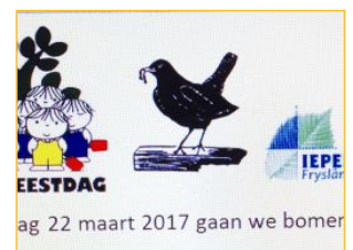
Boomfeestdag, Gauke Dam