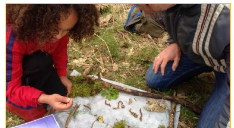
Natuursprong Kollumerwaard, natuurschilderij