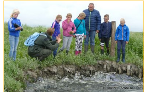
Pierewaaien bij Holwerd