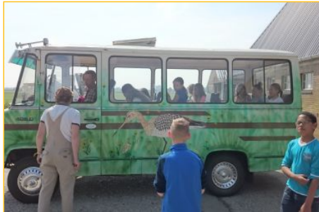
Op Avontoor bij de Boer